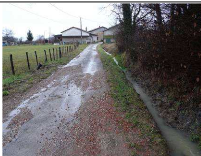
Ruissellement sur les zones de culture et débordements au niveau de la voirie