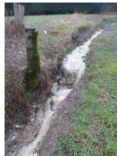
Erosion au niveau des eaux provenant du Mas Gentet et fossé au Mas Boucher